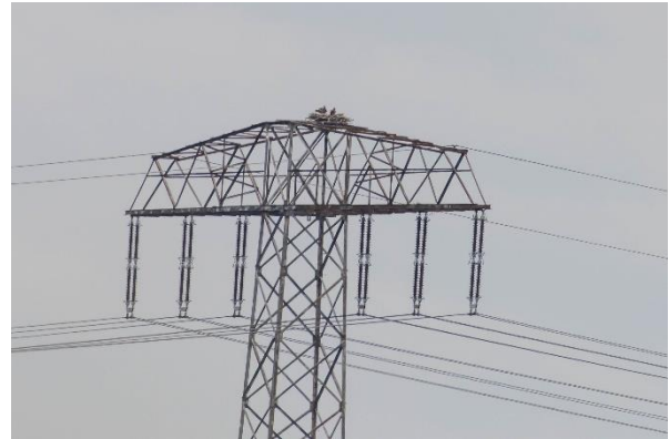
2 fiskeørne på rede i toppen af elmast.

Herfra kørtes videre mod byen Federow, Kargow, hvor vi besøgte et informationscenter om Müritz nationalpark, og her kunne der bl.a. ses direkte tv fra en fiskeørnerede i nærheden. Der yngler mange fiskeørne ved søerne i området. Fiskeørnene bygger rede på toppen af elmastene, hvor der er opsat en anordning, hvor fiskeørnene kan bygge rede.