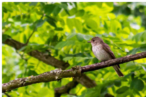
Grå fluesnapper ved hotellet.

Morgenturen ved hotellet var endnu et forsøg på at finde vendehalsens rede, og det lykkedes endelig, så afgang fra hotellet blev udsat, så alle fik mulighed for at se redehullet.