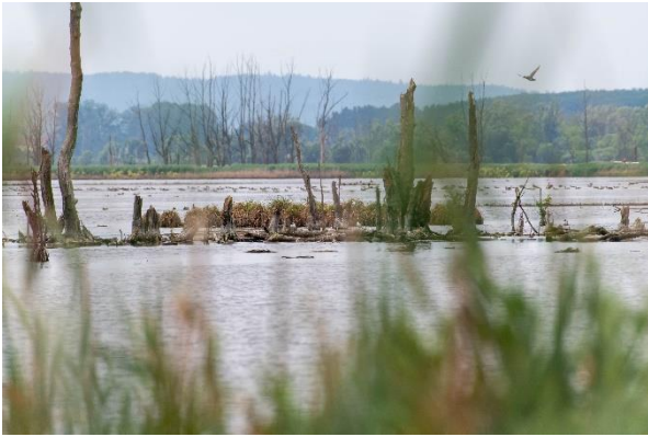
Oversvømmede enge – Grosser Rosin.

Nogle af deltagerne blev sat af bussen lidt uden for den lille by Kützerhof og gik turen langs de oversvømmede enge og mens resten af deltagerne tog bussen til fugletårnet, der ligger for enden af vejen ved floden Peene.