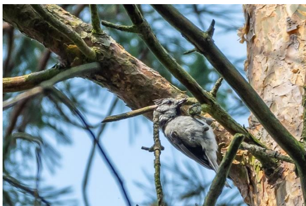
Topmejsje på vejen mod Warnker See.

Afgang fra hotellet kl. 9.00 til enden af Specker Strasse i Waren. Herfra var der gåtur til fugletårn ved Warnker See, hvor vi bl.a. så havørn, sorthalset lappedykker, troldand, hvinand, fjordterne, tårnfalk, topmejsje, sølvhejre, taffeland, engpiber, allike, skarvkoloni. Dem der ikke ønskede at gå med på turen, blev sat af og kunne nyde udsigten over Feisnecksee.