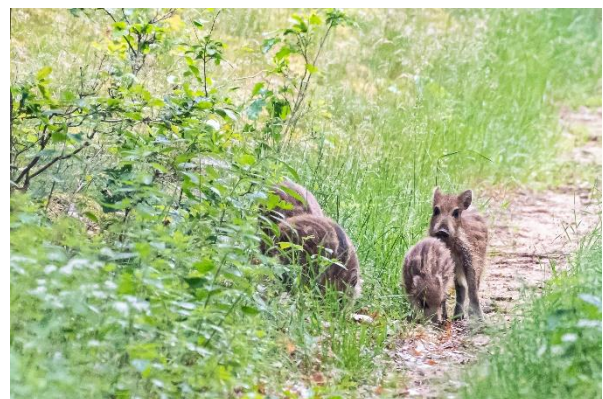
Vildsvin tæt på hotellet.

Der blev allerede her set rødrygget tornskade og vendehals.