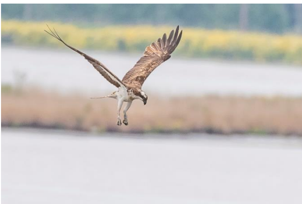
A8 H6 fisker ved Grosser Rosin: Foto: Ib Misfeldt

Sølvhejre, sortterne, sorthalset lappedykker, hættemåge, fjordterne, vandrikse blev hørt, fiskeørn, rød glente, sort glente, knopsvane, knarand, gråand, spidsand, blishøne, trane, havørn, rørsanger, drosselrørsanger, savisanger, rørspurv, skægmejse, landsvale, skarv, fiskehejre, grågås, gravand, musvåge, vibe, gøg, sanglærke, sjagger, nattergal, gransanger, gulbug, gråkrage, stær og pirol hørtes ved fugletårnet.