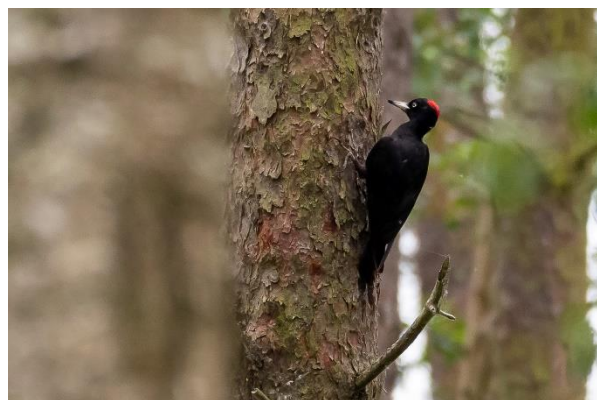
Sortspætte: Foto: Ib Misfeldt

Fra Bock gennem skoven på turen tilbage til hotellet blev der set/hørt bl.a. musvåge, gærdesmutte, spætmejse, engpiber, skovsanger, stor flagspætte, sortspætte, løvsanger, fuglekonge, rødtoppet fuglekonge, gråspurv, fiskeørn, pirol, sangdrossel, træløber, grønspætte, ringdue, grågås, hvepsevåge, hvid vipstjert, musvit, sjagger, rødstjert og endelig nåede vi hjem efter en lang og spændende gåtur på ca. 10 km.