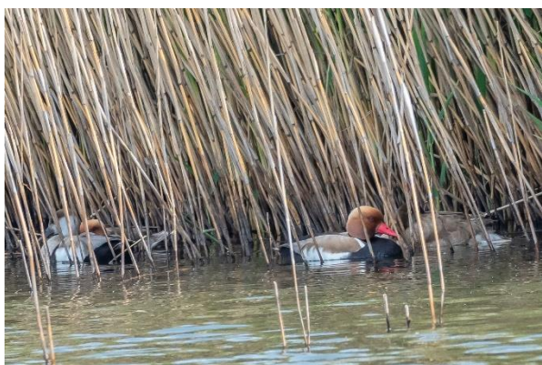
Rødhovedet and i fiskedammene ved Bolter Schleuse.

Efter morgenmad og smøren madpakker var der afgang fra hotellet kl. 9.00 til fiskedammene ved Bolter Schleuse, Reclin .