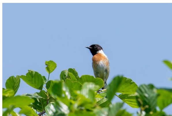
Sortstrubet Bynkefugl i nærheden af Federow.

Turen rundt omkring Hofsee i Federow er ca. 3 km. og man kommer igennem kulturlandskab, skov, sø og byen Federow. I skoven var der flere spættehuller, men der blev hverken set eller hørt spætter. På rundturen blev der bl.a. set/hørt sortstrubet bynkefugl, fiskeørnerede i toppen af et træ, bomlærke, drosselrørsanger, rødrygget tornskade, sumpmejsje, trane, vandrikse hørt, huldue og hvepsevåge. I det åbne landskab bemærkede vi også her det store antal Tidselsommerfugle, der var ankommet til det nordlige Europa.