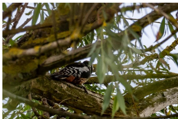
Mellemflagspætten var svær at finde bag træets løv.

Kranichrast, en tur på ca. 10 km., og det andet hold tog vores bus tilbage til Bolter Kanal, hvor de