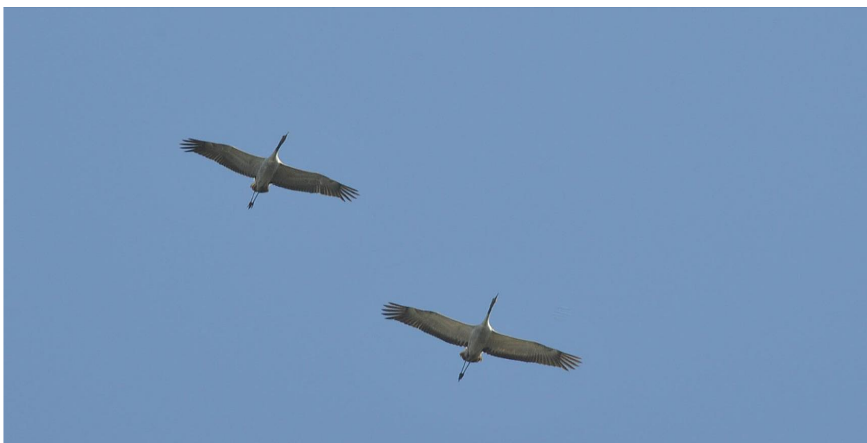
Herunder kredsene Traner