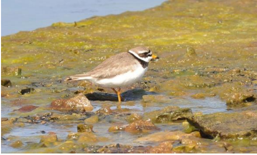
Stor Præstekrave fra Ottenby

Torsdag d. 11.05. Første opsamling på turen var i Nykøbing F. (på Cementen) kl. 08.00, herefter Vordingborg kl. ca. 08.30 ved det gamle posthus. Næste sted var Næstved (Kvægtorvet) kl. 09.00. Vi havde et kort stop ved motorvejen i Rønnede og ved sidste afkørsel inden Øresundsbroen for at samle de sidste deltagere op.