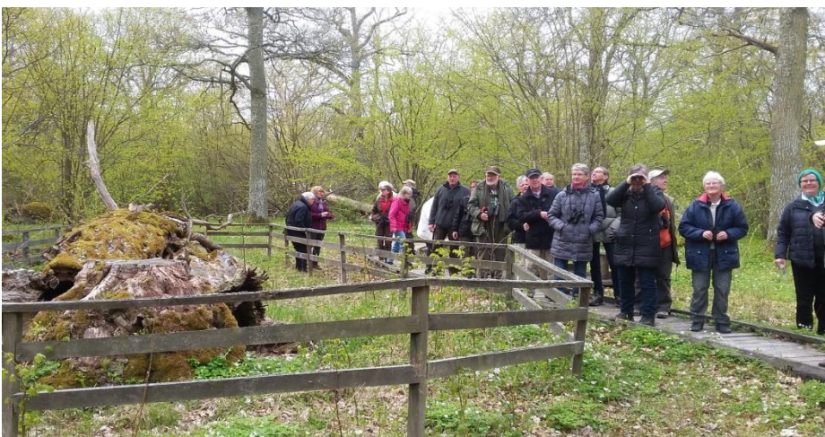
Glade turdeltagere ved de gamle Ege Halltorps Haga