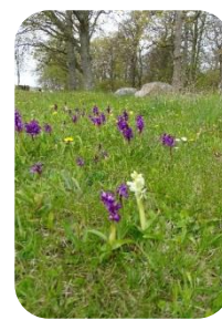
Og Tyndakset Gøgeurt igen, også i hvidt

Samlet artsliste for turen i den rækkefølge som de blev set på turen: