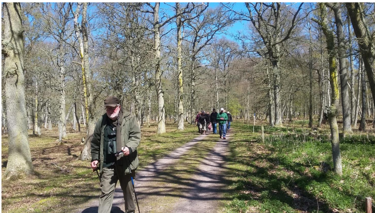
På tur i Ottenby Lund

Der lå masser af Grågæs ude i vandkanten og en masse ænder som var svære at artsbetemme i varmeglimmeret. Storsporverne hørtes og fløj omkring på engene. Viberne tumlede rundt i deres territoriehævd. Dejlig forårsstemning.