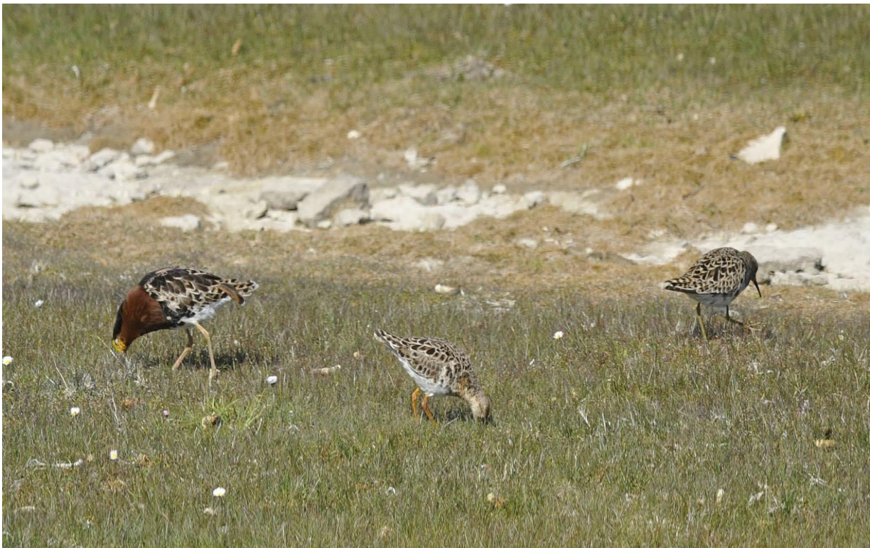
Brushane med brun krave og to Brushøns

På vej ned til fyret ved Ottenby så vi langs vejen flere flokke af Brushøns/haner