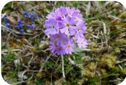
Melet Kodriver

Vi fik også kigget lidt på Orkideer bla. Tyndakset Gøgeurt og en blomst Melet Kodriver.