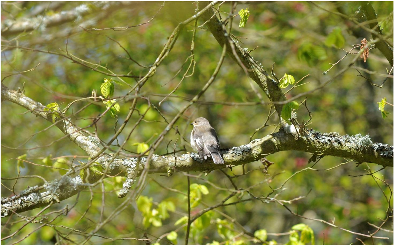
Hvidhalset Fluesnapper hun set fra P-pladsen.

Turen gik videre til Møckelmosen nr. 81. Vi ankom omkring kl. 14.40, og her legede et par Ravne omkring p-pladsen. Det tørre Alvaret belv forceret på vej ud til søen. Undervejs blev der set Bynkefugl, Stenpikker, Traner (i luften) og på søen nogle Sangsvaner. Enkelte Løvsangere sad i småtræer og buske.