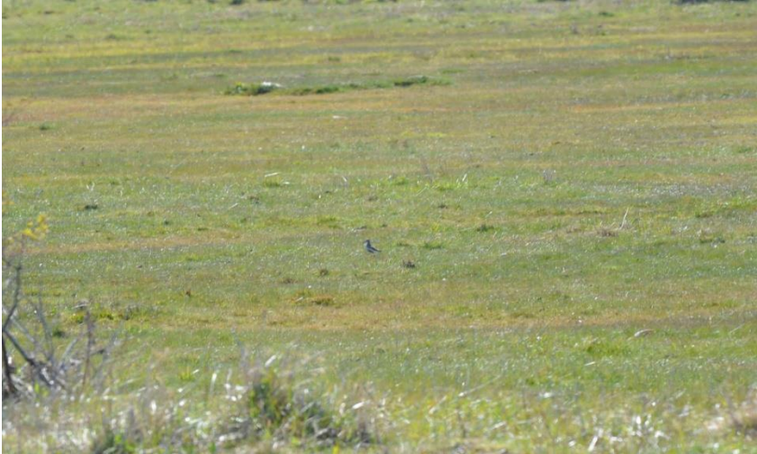
Engrylen fylder ikke meget

Vi gik ud langs vandet mod det første tårn og her på engen gik en Temmincksryle tæt på. Et par Bramgæs blev jaget væk af en arrig Canadagås. Ude i vandet sås Klyder, Grågæs, Tinksmed, Hvidklire, Havterne, Skarver, Stor Kobbersneppe blot for at nævne noget af de mange arter, vi så herude.