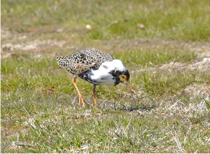
Brushane med hvid krave