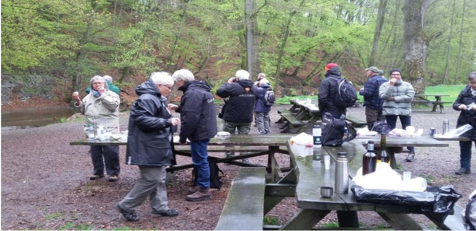
Frokost i Røverkulen

Turen fortsatte med et langt stræk kun afbrudt af en kort "tissepause" helt til Knissa Mosse lokalitet nr. 24 efter bogen "Fågellokaler på Øland" udgivet af Ølands Ornitologiske Forening 2010. Vi ankom til lokaliteten kl. ca. 16.30. Lokaliteten ligger ca. 30 km nord for Borgholm ud til vestkysten. Som det ses på billedet var det temmelig overskyet men dog tørvejr, da vi ankom til søen. Vi havde flere forskellige småfugle i krattene bla. flere Gærdesangere.