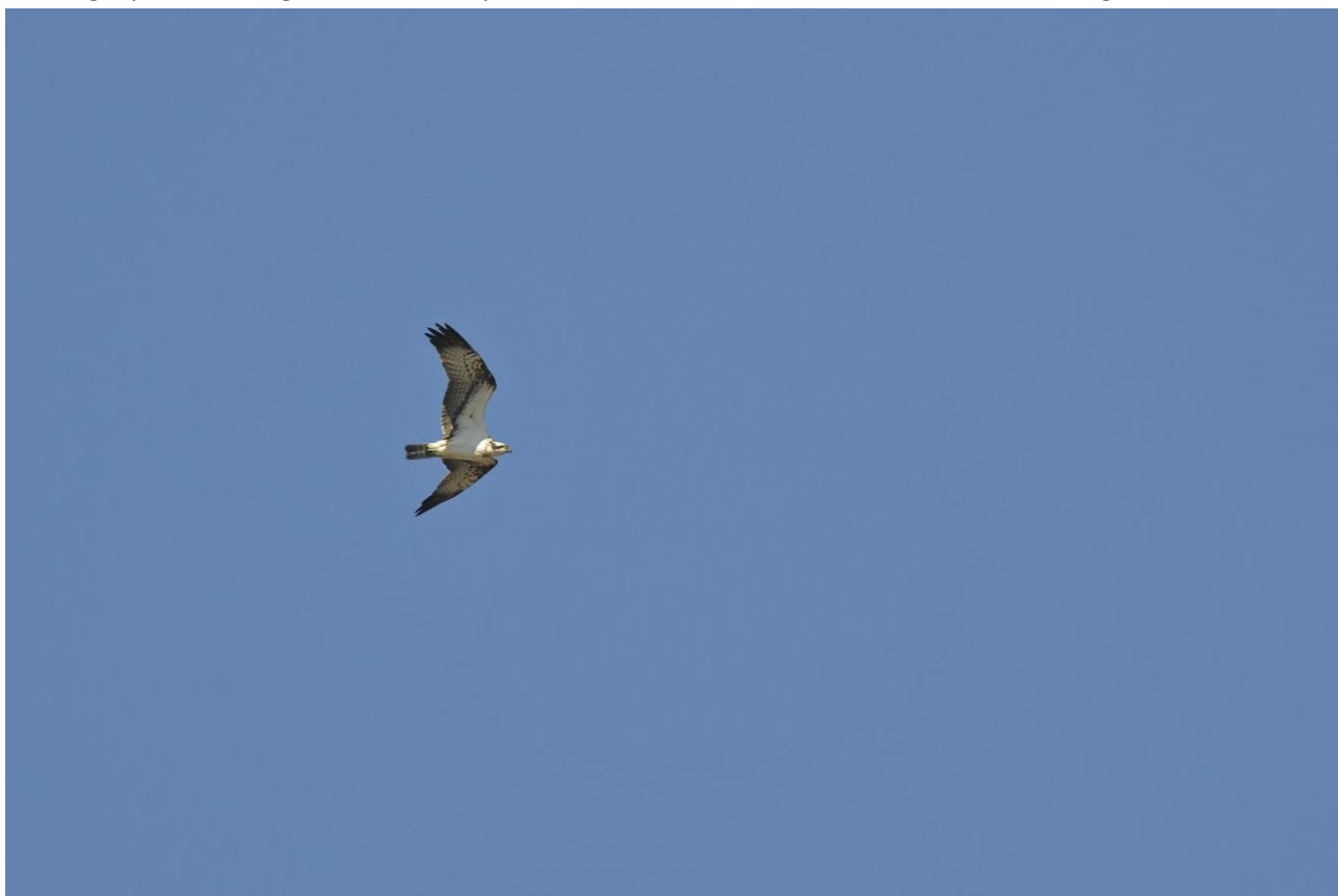
Fiskeørnen på vej ud

På vej ud over broen mod tårnet så vi Havørn, Fiskeørn, Traner, Vandrefalk, Musvåge og flere Lærkefalke trak ind over skoven. Vi så også en Rørhøg fouragere over engen. Fra tårnet kunne vi se en hel del vadefugle på strandene bla. Alm. Ryle, Hvidklire, Store Præstekraver, Strandkader og Rødben