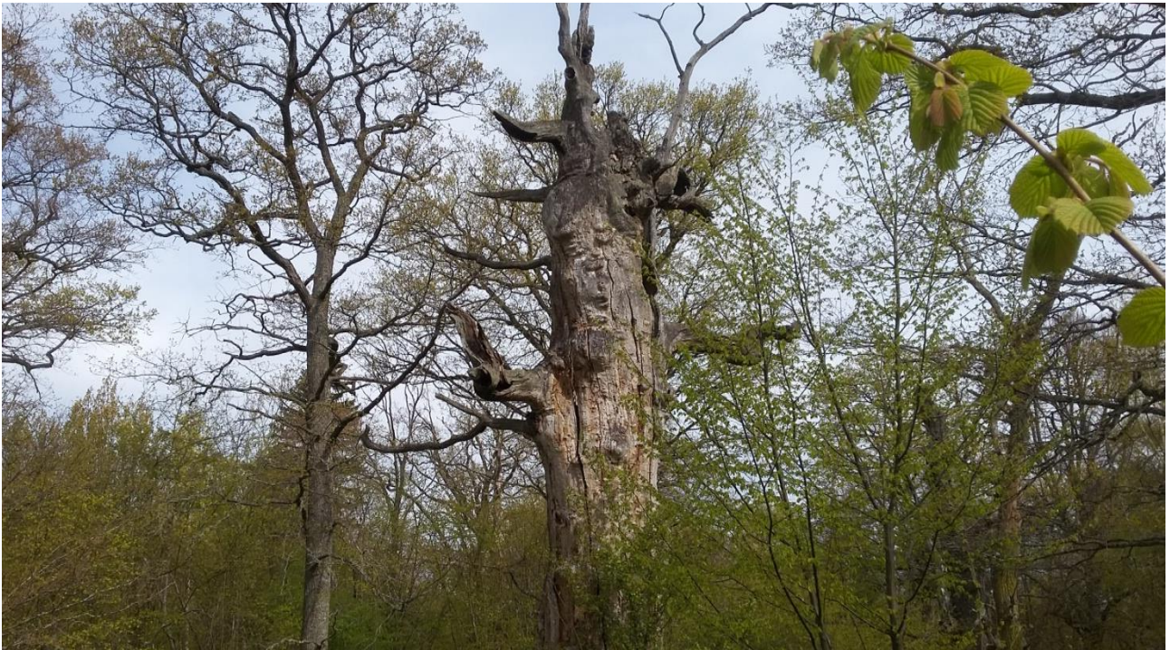
Halltorp Hage gammel Egetræ.

Der blev gjort et par pauser på hjemturen, den sidste ved et indkøbscenter ved Malmø hvor mange fik vekslet de svenske penge, som ikke var brugt, tilbage til danske.