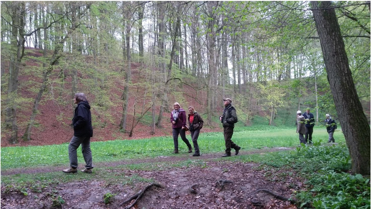
Fra gåturen i Røverkulen

Første stop i Sverige var ved Røverkulen, i Skåne, her kunne vi spise vores medbragte mad ved borde/bænke. Og der var god plads til bussen. Mens vi spiste kunne vi nyde flere Brogede Fluesnappere som fouragerede langs åen i det regntunge vejr. Der var også en del andre småfugle bla. hørtes en Gøg. Der hørtes Rødstjert, Løvsanger og vi så en Spætmejse. Der vil være en samlet artsliste bagerst i rapporten, hvor alle fugle er nævnt.