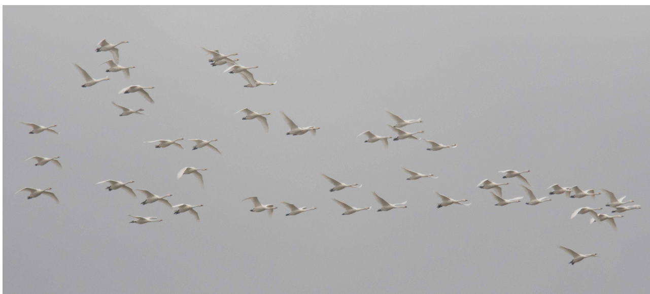
Pibesvaner, Hyllekrog 23. marts 2016

Antallet af Toppet lappedykker lå i år også meget lavt med kun 127 trk., mens det gik lidt bedre for Gråstrubet lappedykker (467), men dog kun i kraft af disse 2 gode dage: 9/4 110 og 14/4 226 (næsthøjeste tal fra lok). Med andre ord næsten trefjerdedele af sæsontotalen på 2 dage. Nordisk Lappedykker sås med i alt 10 trk.+ 1 rst. i tiden 26/2 – 13/4, hvilket netop er hidtil højeste træktotal, men samlet set ikke bedste år når både træk og rast sammentælles. Flest fugle sås 9/4 med 4 trk. Igen i år sås mange suler for stedet: 26/2 – 3/6 i alt 9 fugle. Det blev hidtil bedste år for Pibesvane med 339 trk. i tiden 8-24/3 med flest 17/3 80 og 21/3 78. Dens gulnæbbede fætter kom op på de sædvanlige beskedne antal (196) og her flest 7/3 89.