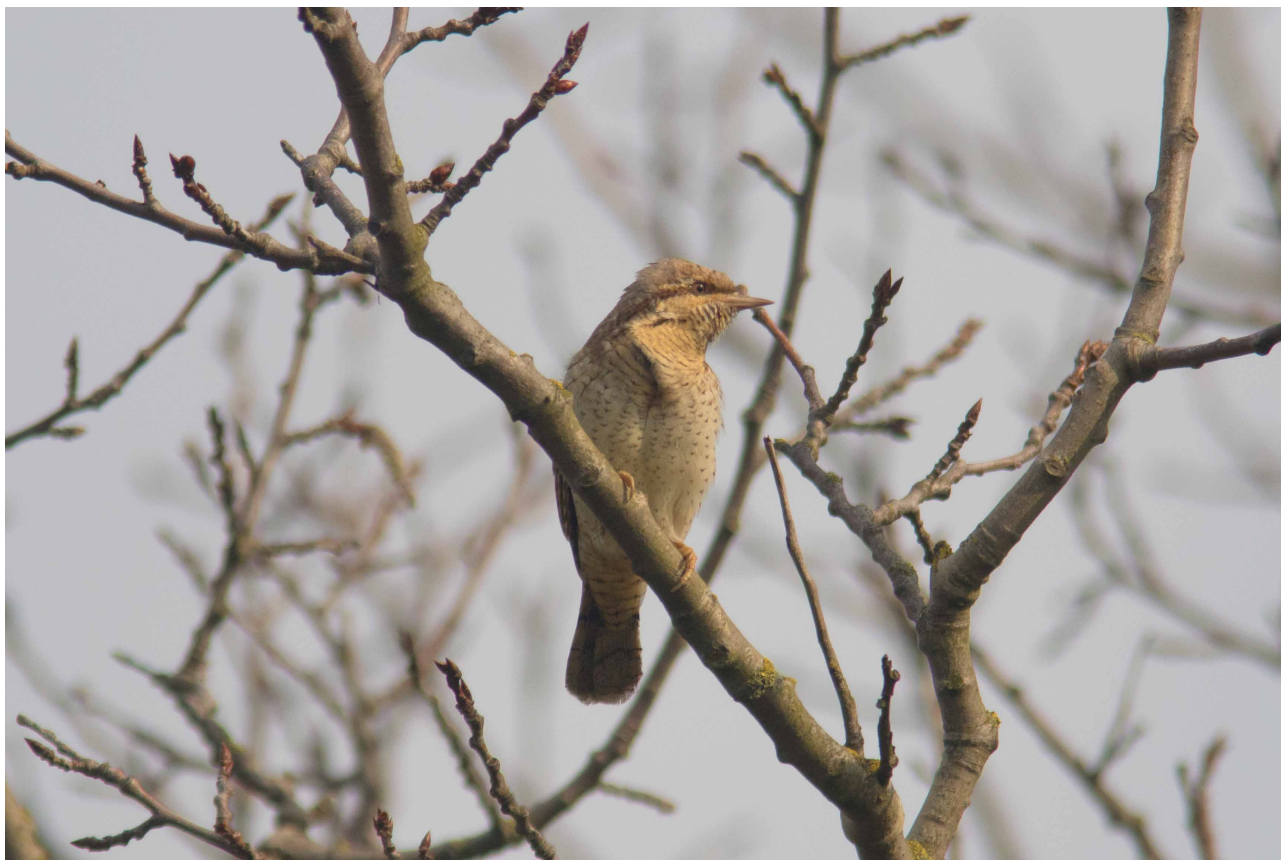
Vendehals, Saksfjed Inddæmning 3. maj 2016

på direkte træk. Et rasttal af Huldue kan dog nævnes 6/3 116 rst., som sikkert er vinterflokkene fra Bjernæs Husby (her op til 170) på udflugt.