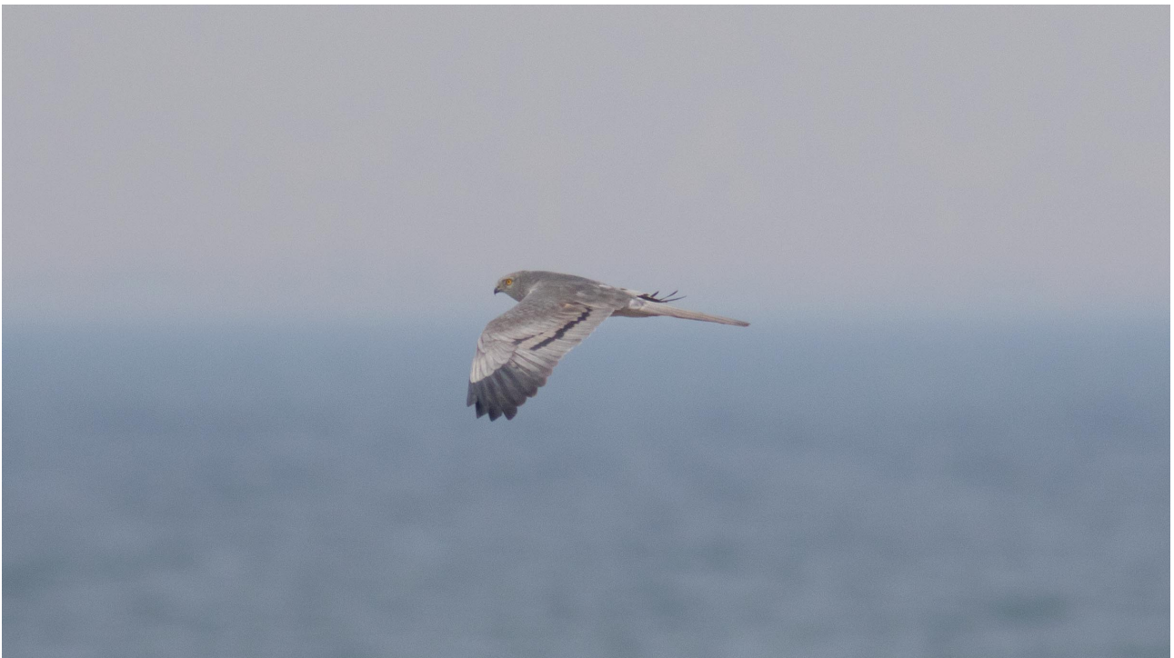
Hedehøg han, Saksfjed Inddæmning 3. maj 2016

Det blev til hidtil ringeste år for Havlit (742) med hele 55,2% under gennemsnittet! Største dag faldt igen i år tidligt med 1/3 178 trk. Derimod er Sortand (84.632) stadig rigtig godt kørende med 20 dage med over 1000 trk. (11/2 – 15/4) og her flest 25/2 5065, 21/3 9860 og 22/3 7000. Det gik også fint for Fløjlsand (598), som havde næstbedste forår, men her er de største trækdage temmelig beskedne (max.14/2 34) p.g.a. et meget udstruktet træk igennem hele foråret. De næste 4. arter havde ligeledes deres næstbedste forår for lokaliteten, således både for Hvinand (492), Lille Skallesluger (38), Toppet Skallesluger (12.146) og Stor Skallesluger (271). Toppet Skallesluger havde desuden et meget bemærkelsesværdigt tidligt træk i år, hvor de største dage allerede lå med 14/2 1121, 26/2 530, 29/2 1265 og 1/3 732. Dog sås stadig en klar top i april måned: 10-15/4 i alt 1772 fugle og her flest 12/4 495. Antal trækkede fugle efter endt obstid blev ud fra opgjorte halvtimetotaler og lignende dage skønnet til ca. 1450. Som et forsøg blev direkte trækkede toppede skalleslugere i lighed med Ederfugl også kønsbestemt dette forår. I alt 7334 fugle ud af totalt 12.146 trækkende (60,4 %) blev bestemt og andelen af hunfarvede fugle endte på 35,4 %.