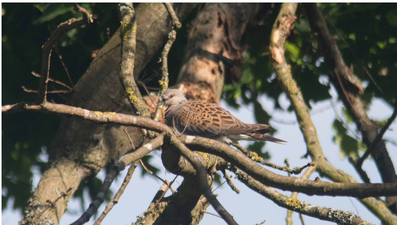
Turteldue, Saksfjed Inddæmning 2. juni 2016

Det mest interessante for alkefuglene i denne omgang var nok at Alk overhalede Lomvie for første gang siden tællingerne startede i 2008: Lomvie (35), Alk (41), Alk/Lomvie (19) og Tejst (3).