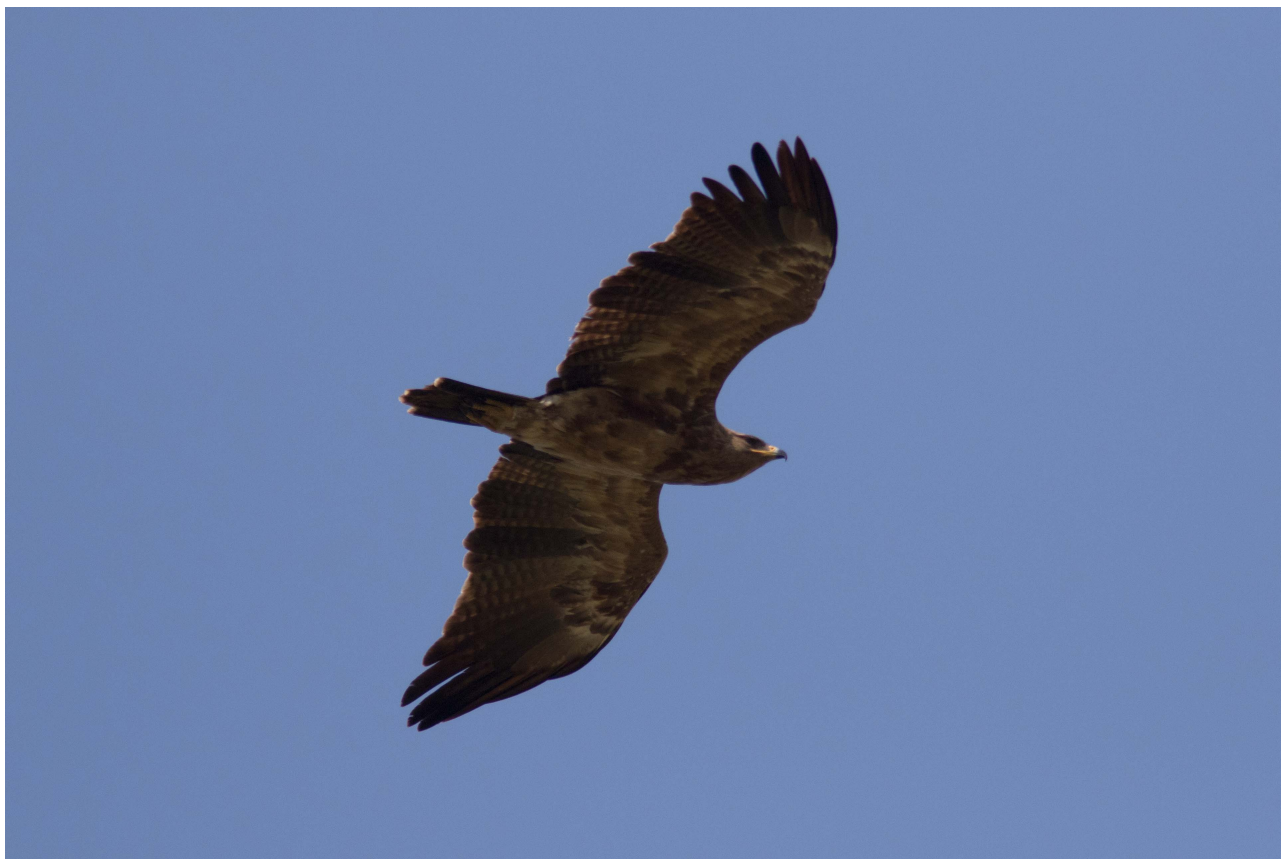
Lille Skrigeørn 3K, Hyllekrog 14. maj 2016

Vintervejr var der ikke meget af i år, da frost, sne og is var indskrænket til perioden ca. 29/12 og kun frem til 23/1. Herefter et par dage med tåge efterfulgt af nærmest forårsvejr allerede fra den 25/1 (op til +5 gr.). Selvom den efterfølgende periode frem til 10/2 var meget mild, var den mest præget af regn og kraftig blæst, hvorfor der først blev startet op med trækobservationerne på denne dato. Der har således i denne tidlige periode nok alligevel i alt passeret et par tusinde fugle af de tidlige arter, især andefugle (f.eks. Ederfugl og Sortand).