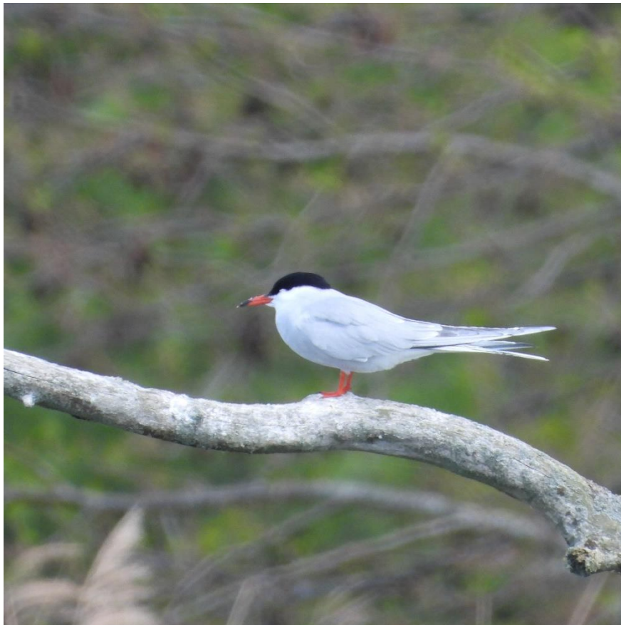
Fjordterne: Foto: Michael Thelander