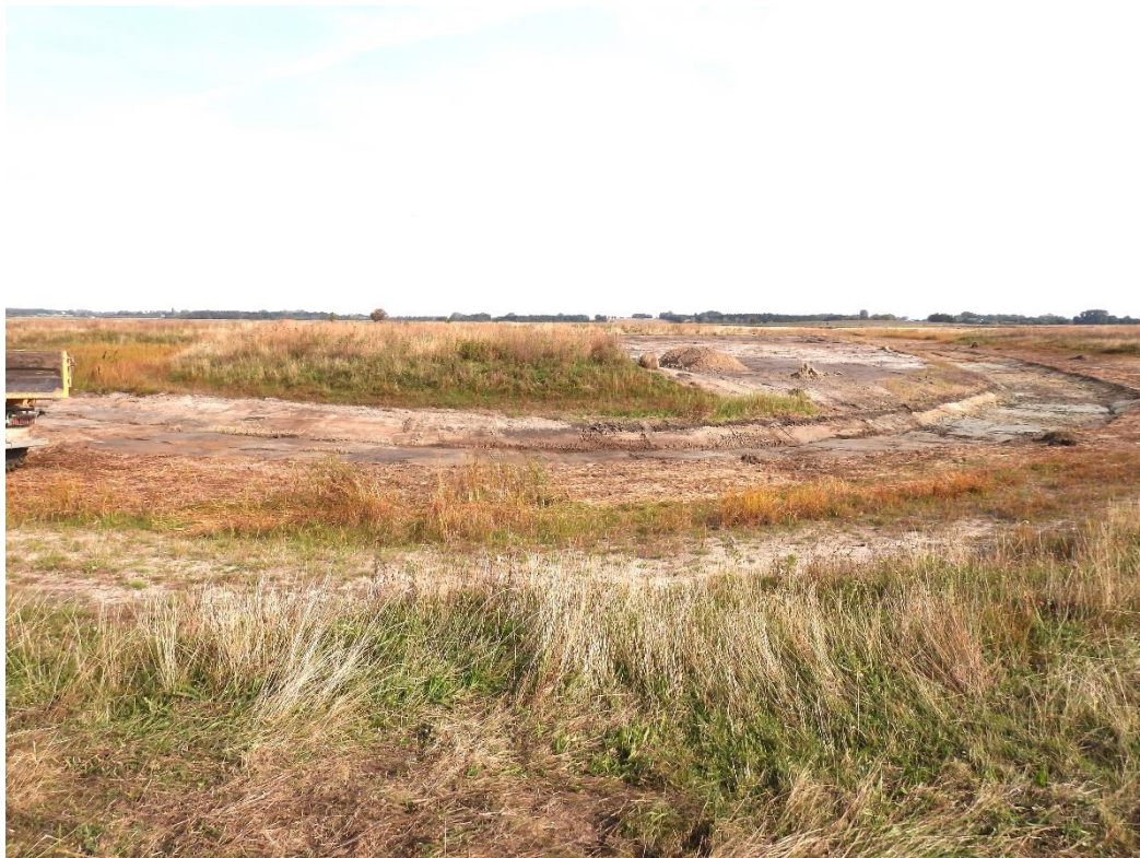
Klydesøen på Avnø bliver renoveret- november 2022.

Forvaltningstiltag: Slåning af Fugleøen i Klydesøen og regulering af rævebestanden/mink