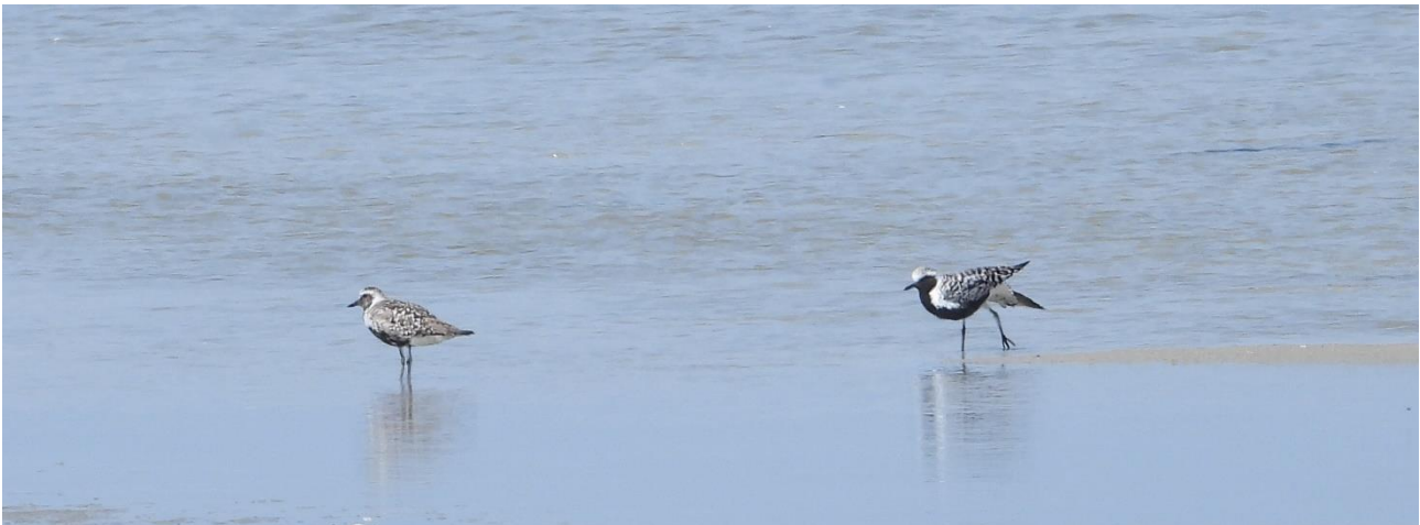
Fugleholm, Rødsand 11/6 2022: Rastende Strandhjejler.

Meget stor blandingskoloni af Havterne, Dværgterne og Klyde, som vi ikke ville forstyrre. Derfor lidt større interval af vurderet ynglepar end normalt.