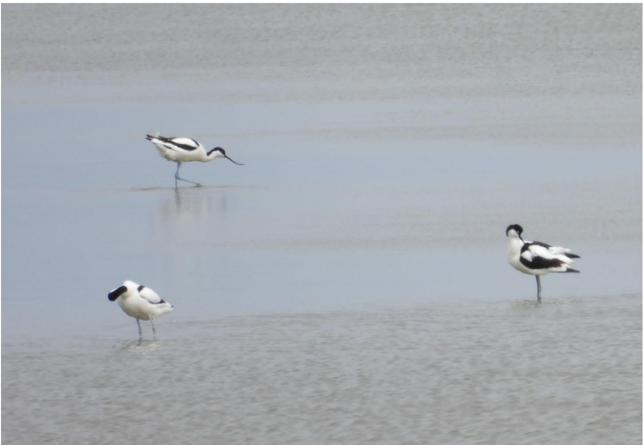
Enehøje Nordlige sø 20/5 2022: Klyder.

Havterne vendt tilbage til Enehøje som ynglefugl, og bl.a. flere ynglende klyder og stormmåger på den sydlige del.