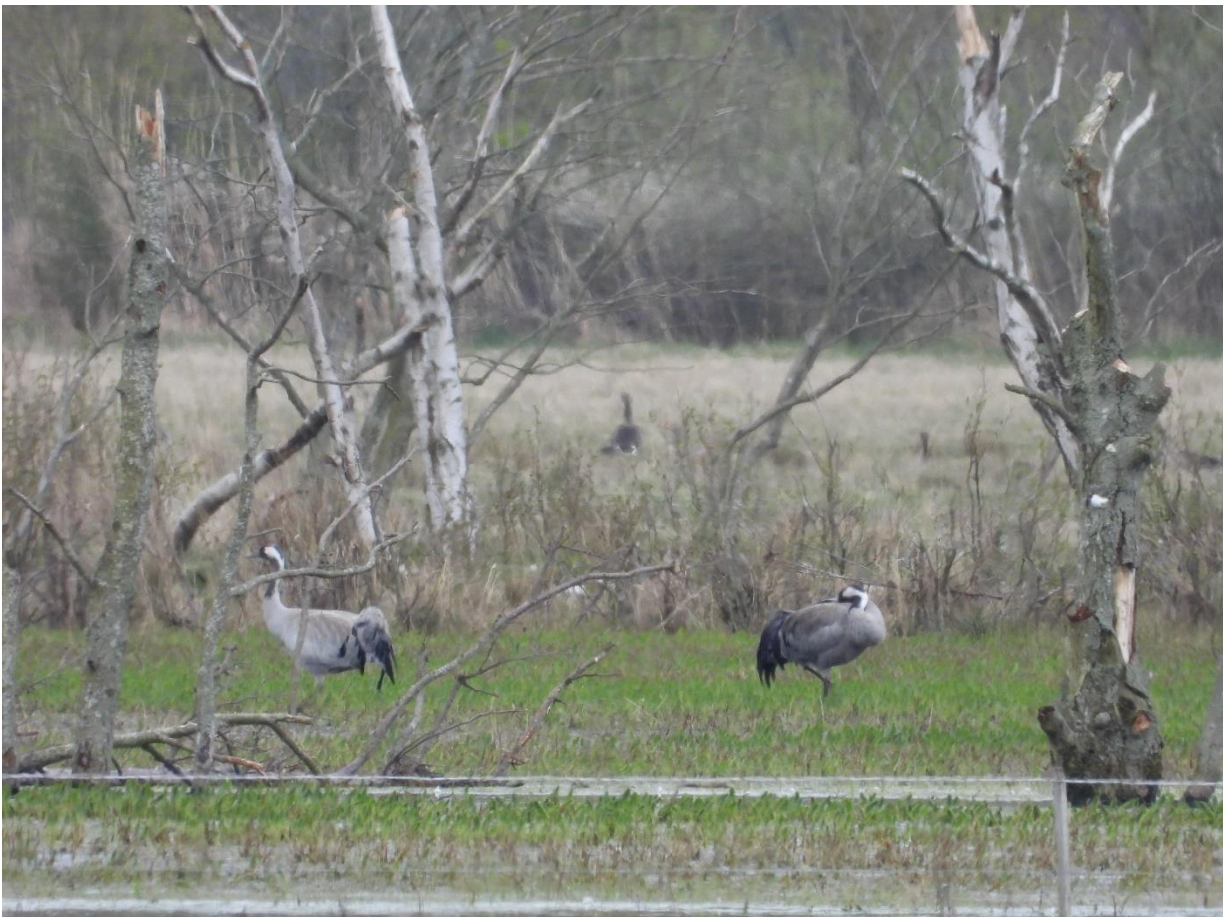
Bøtø Enge 1/5 2022: Traner.

Bøtø Nor: Der er slået høj vegetation ved en af søerne og ryddet et lille krat ved samme i september. NST efterlyser mere konkrete plejeønsker, hvis der er sådanne.