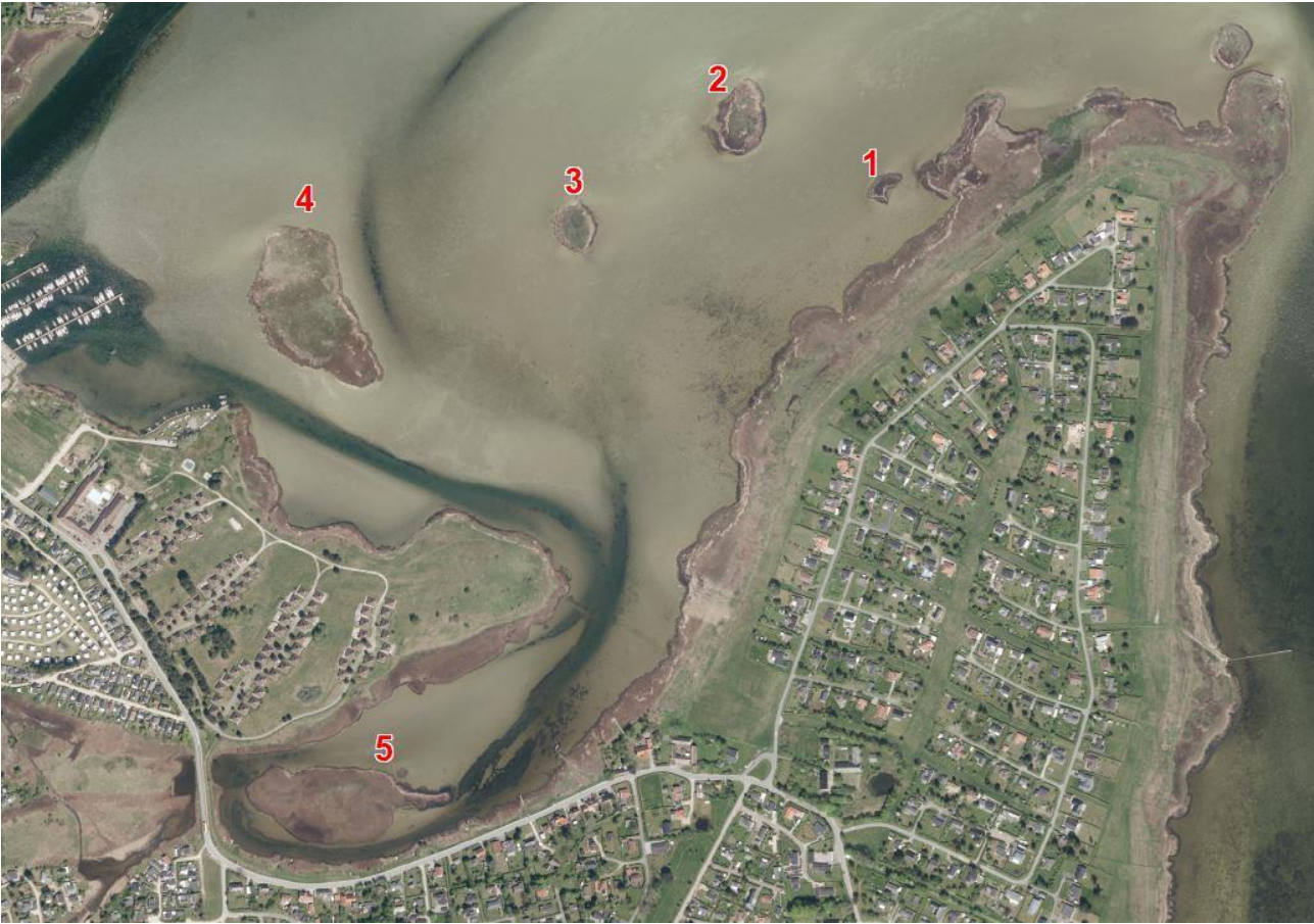
Placering af Lars Thuns Holme i Karrebæk Fjord