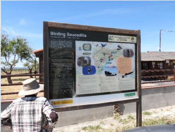
Besøgscentret og området ved Saucedilla.

Det var godt, vi besøgte stedet ret tidligt om morgenen på en hverdag. Allerede ved 10-tiden begyndte der at komme ret mange andre turister og skoleklasser.