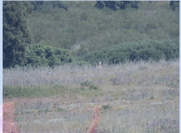
Munkegribbe og Stortræppe på Belén sletten.

Fortsatte efter en frokost i Santa Marta de Magasca til vejstykket vest for, hvor der er sat mange redekasser op til Ellekrager. Ud over Ellekragerne så vi bl.a. Rødhøne meget tæt på.