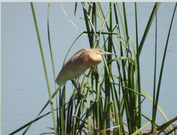
Tophejre og Purpurhejre nær Saucedilla.

Da vi syntes, vi havde set nok, valgte vi at køre over til vådområderne omkring Saucedilla.