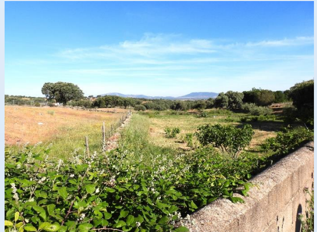
Blåskade og landskab ved Talaván.

Om eftermiddagen gik vi tur i Torrejón el Rubio og fik bl.a. et glimt af en syngende Sydlig Nattergal.