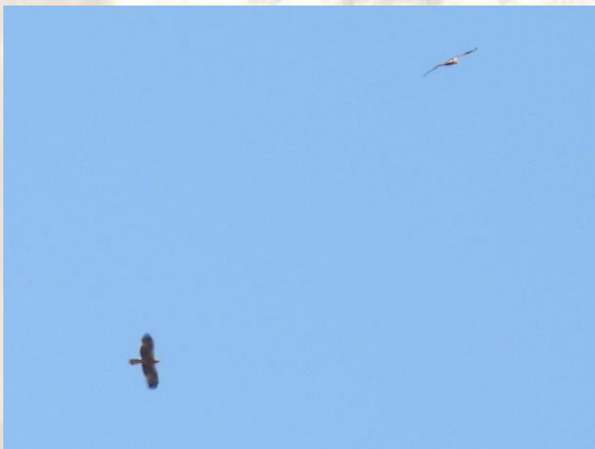
Mulig Høgeørn til venstre.

Høgeørn: 0-2. Bestemt til Høgeørn i Torrejón el Rubio, men B er blevet usikker på bestemmelsen. Den ene af de tre fugle var i hvert fald en Dværgørn i mørk fase.