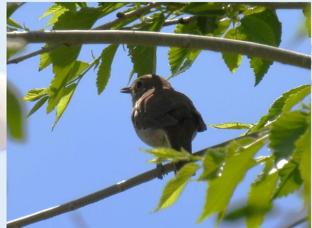
Torrejón el Rubio og Sydlig Nattergal.