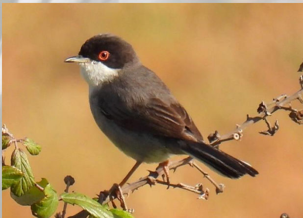
Han af Sorthovedet Sanger nær hotellet.

Om eftermiddagen gik vi alle tre en tur østpå ud gennem Torrejón el Rubio til nogle damme. En Gulirisk hun samlede redematerialer, Rødhøne på en mark, Dværgørn og de sædvanlige gribbe i luften.