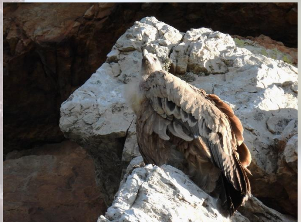
Blådressel og Gåsegrib ved Monfragüe-borgen.