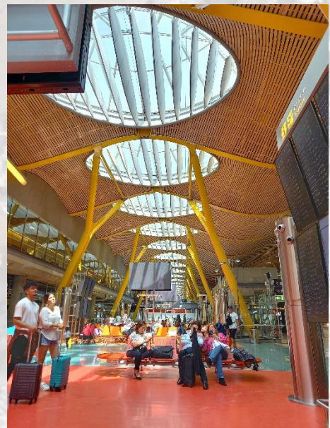
Den flotte lufthavnsbygning i Madrid.