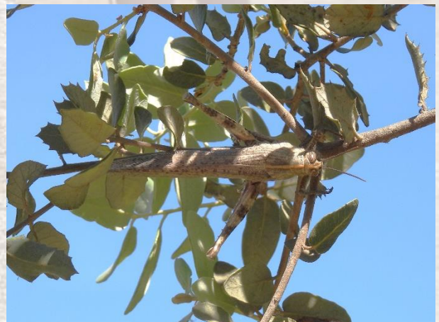
Figur 1. Tømrerbi ved Puerto del Pico-passet (Gredos) og Ægyptisk Markgræshoppe ved Torrejón el Rubio.