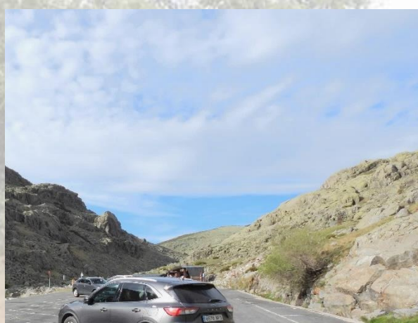
Reservat syd for Hoyos del Espino - 2018 til venstre og 2023 til højre.

Hvor der på stepperne var et rigt blomsterflor i 2018, var der meget tørt og få blomster i 2023.