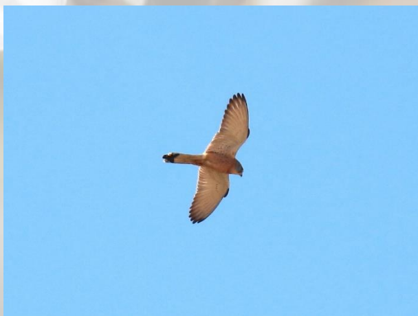
Lille Tårnfalk han ved tyrefægtningsarenaen i Trujillo.

Dagen gik med en tur rundt i steppe- og dehesa-områderne. Startede med at køre til Trujillo for at se på de Små Tårnfalke ved tyrefægtningsarenaen. Vi så omkring 20.