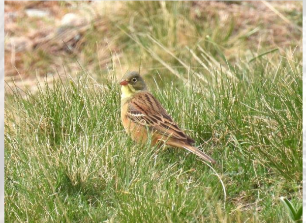
Stien op i Gredos-bjergene og en Hortulan.

Der var fint med småfugle, bl.a. Bjergværlinger, Stendrosler og en flot syngende Sydlig Blåhals. Se film med den syngende Blåhals.