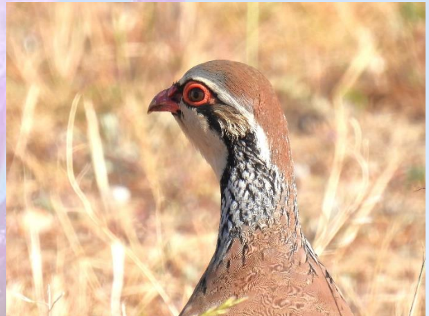
Ellekrage og Rødhøne vest for Santa Marta de Magasca.

Hjemturen gik via Monroy, hvor vi så to Skadegøge, med hjemkomst klokken 19 til hotellet.