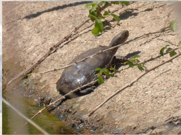
Maurisk Sumpskilpadde ved Torrejón el Rubio.

Forskellige større og mindre firben: Ret almindelige.