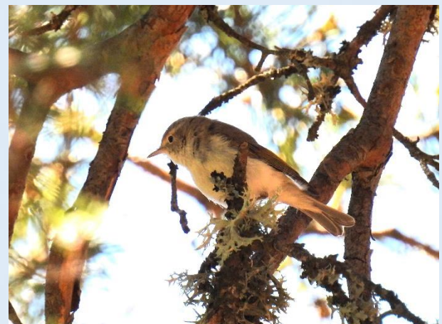
Udsigt fra Puerto del Pico og Bjergløvsanger ved Parador de Gredos.