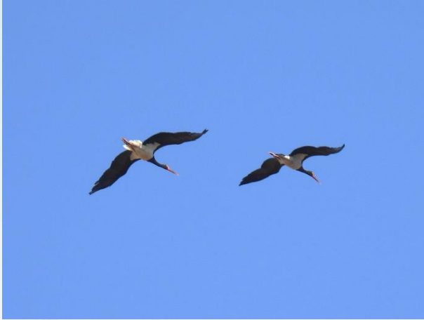
Sorte Storke og udsigt over dehesa-landskabet.