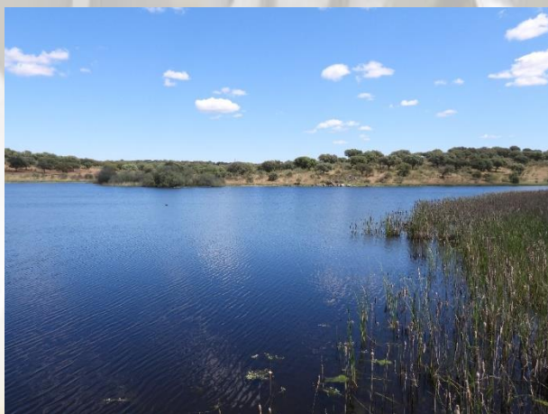
Dam ved Torrejón el Rubio og flyvende Gåsegrib.