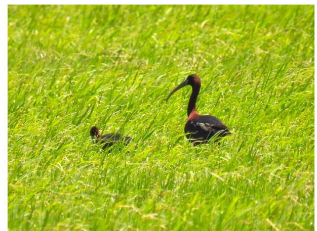
Figur 3. Der er også salt på overfladen af de indtørrede søer, som ikke anvendes til saltindvinding. Sort Ibis ses i hundredevis i Camargue, bl.a. på de mange rismarker.

Op og ude ved campingpladsen klokken 6. Travede den "sædvanlige" morgenrunde. Kørte derefter den helt store runde i Camargue. Vi startede som i går ved vestsiden af Le Petit Rhône nord for Saintes-Maries de-la-mer, hvor vi så Nathejrer meget fint. Derefter kørte vi nord om den store sø, Étang du Vacarès, på D37 og kiggede bl.a. ved et fugletårn der. Kørte en bue nordpå til Gageron og så videre sydpå ad VC134 med Salin de Giraud. "Salin"-delen af bynavnet kommer fra den