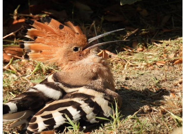
Figur 6. Travetur i "Des Alpilles" og en Hærfugl på campingpladsen.

Efter morgenrunden kørte vi til det lille bjergområde Parc naturel régional des Alpilles nordøst for Arles. Her blev fuglelisten suppleret med nogle af de mindre arter såsom Hedelærke og Turteldue. Spiste på tilbagevejen frokost på Domaine de Méjanes og gik en god tur i området.