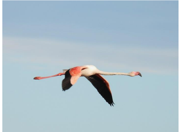
Figur 2. Fra morgenrunden nær campingpladsen. En gammel kanal og en Stor Flamingo.

Campingpladsen, vi boede på, hedder La Petit Camargue. Den er stor og består mest af velindrettede campinghytter. Vi boede i en, som havde fin udsigt over sump-/engområdet.