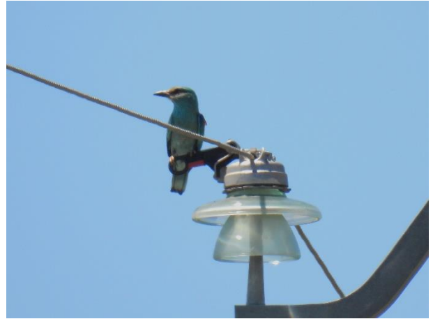
Figur 4. Vi brugte ikke meget tid på det kulturelle. Årsagen til, at vi besøgte borgbyen Aigues-Mortes var, at vi på grund af manglende kufferter havde brug for skjorter, underbukser m.m. Vi så vel omkring 20 Ellekrager i Camargue.

Startede med morgenrunden nær campingpladsen. Kørte derefter en lidt mindre tur. Kørte ad D58 til lige før broen over Gard Buches-du-Rhône og derfra nordpå på vestsiden af denne flodgren til Saint-Gilles og tilbage vestpå ad D6572.