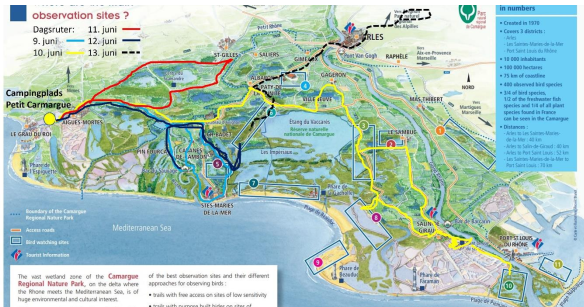
Figur 1. Kort over Camargue med angivelse af dagsruter.

Yderligere information kan fx hentes i " Where to watch birds in the Camargue Regional Nature Park – France ".