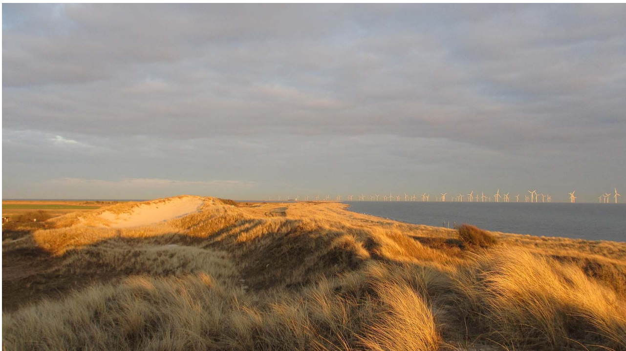
View fra obspladsen ud mod Hyllekrog tangen, 13/4 2012