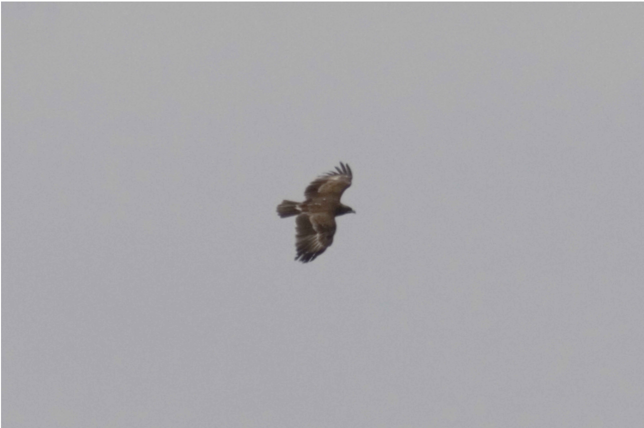
Stor Skrigeørn 4K over Saksfjed Inddæmning den 3/6 2012.

Som vanligt er der ikke meget at bemærke med hensyn til de almindelige småfugle, men Grønsisken (2357 ex.) kom enkelt gang over 1000 fugle: 18/3 1090. Desuden kan en Sortkrage-total på 84 trk. nævnes.