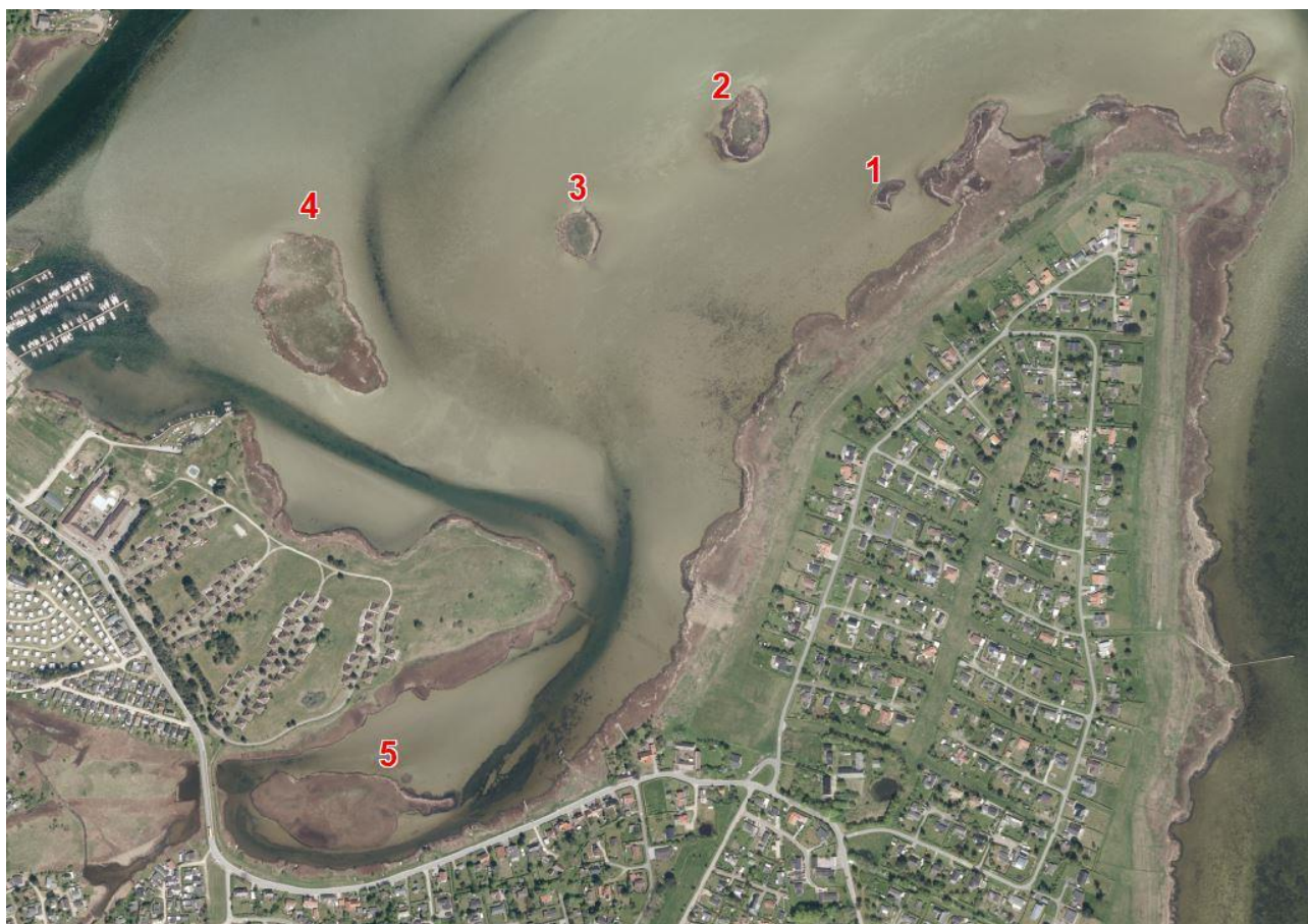
Placering af Lars Thuns Holme i Karrebæk Fjord