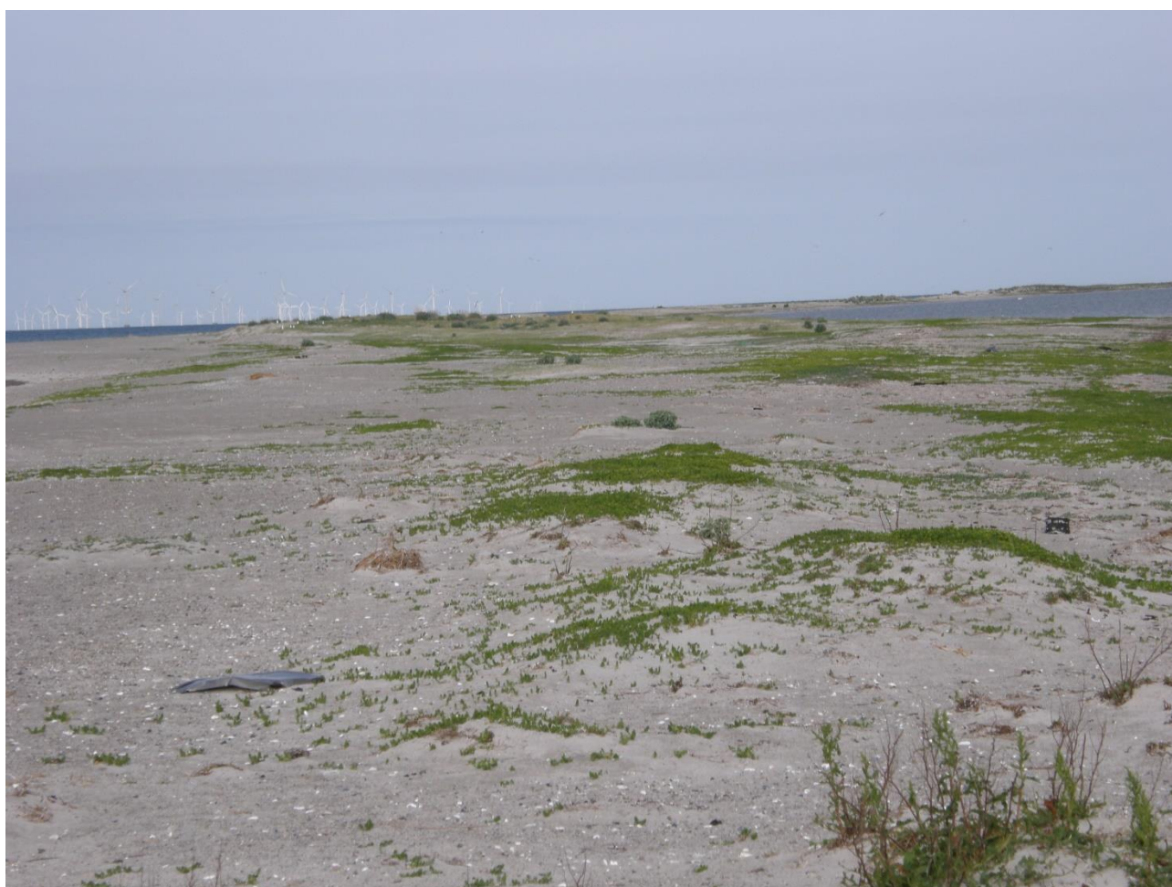
Gode redemuligheder for terner og klyder på en stor del af Fugleholm, Rødsand

Øvrige obs: bl.a.: Havørn 5, Pibeand 2 han, knortegås 4, Alm. Ryle 3, Islandsk Ryle 4, gråsæl 30-35