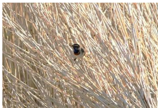
Sydlig Blåhals.

Siden Sydlig Blåhals genindvandrede til Danmark, og det første par blev registreret i 1992 i Jylland, er bestanden vokset til over 700 par, langt hovedparten i Jylland.