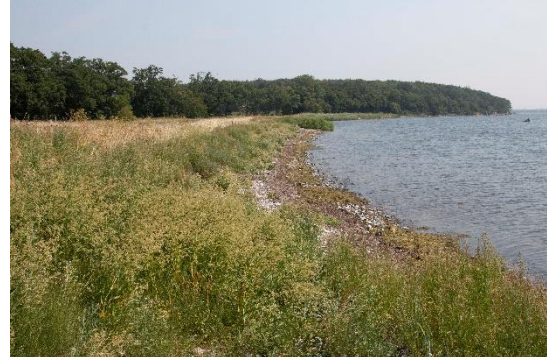
Resle Skov og Valnæs Skov ligger tæt på kysten.

Valnæsvej, indtil motorkørsel bliver forbudt ved en parkeringsplads (54.93038, 11.71227). Herfra kan man fortsætte ad vejen til fods og efter kort tid gå ind i skoven.