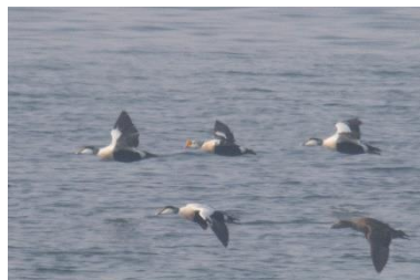
Figur 1. Kongeederfugl han ved Hyllekrog 24. marts.

Sjældne fugle i DOFbasen i DOF Storstrøm den seneste måned!