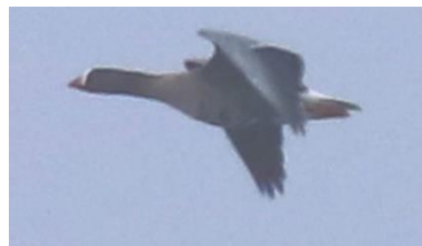
Dværggås ved Roden Fed 15. marts.

Mindst 41 Dværggæs blev set sammen på engene i anden halvdel af marts. Palle Sørensen bemærker i DOFbasen, at der godt kan være flere. Det er svært at få styr på, når der er Havørn i området.