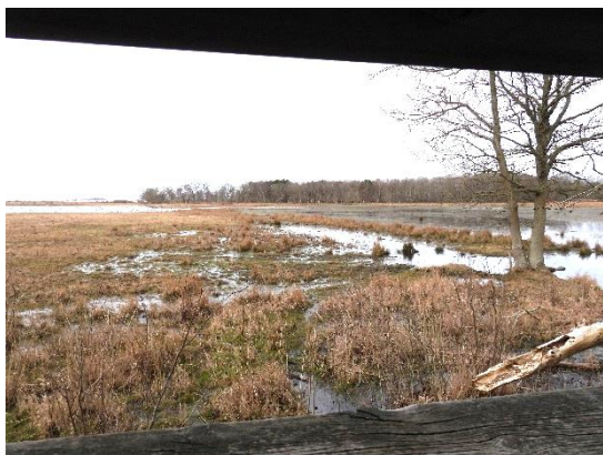
Gåsesøen på Ulvhale. Godt sted for svømmeænder. Velegnet for gangbesværede.

<Her skal der fortælles om, hvilke fugleoplevelser, det er værd at gå efter de kommende par måneder, og hvor man kan se dem.>