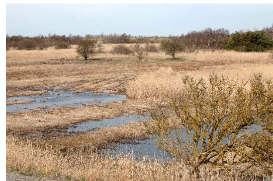
Store rørskovsområder præger Kramnitse Nor. Om vinteren slås nogle af rørene.

Kramnitse Nor ligger ud til Lollands sydkyst og med sin beliggenhed nær det europæiske kontinent, må lokaliteten kunne tiltrække en række sydligt udbredte arter. Men ud over en enkelt drosselrørsanger har det knebet indtil nu. De store rørskovsområder må kunne tiltrække andre rørskovsfugle som savisanger og hvorfor ikke også lille rørvagtel og plettet rørvagtel? Hvis man skal høre disse arter, kræver det, at man natlytter på lokaliteten. Men det er heller ikke svært på en stille aften, hvor man uden problemer kan gå i mørket på diget ud mod havet eller på vejen lige nedenfor diget.