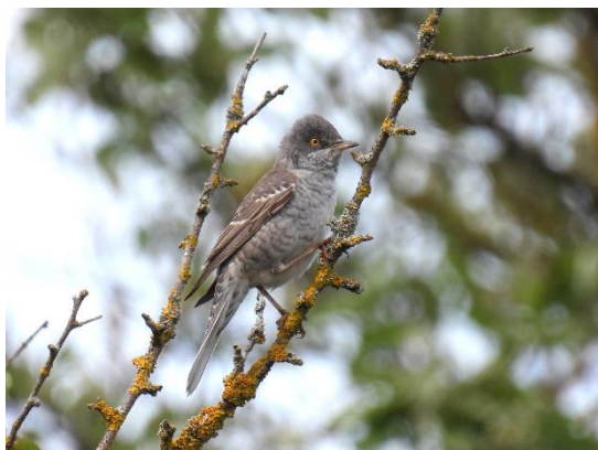
Høgesanger voksen han.

Lille fluesnapper dukkede op med enkelte eksemplarer, men to syngende i Klinteskoven 14. til 21. maj gav flere mulighed for at blive fortrolig med den karakteristiske sang. De opholdt sig i præcis samme område som i 2021, så mon ikke der er tale om gamle kendinge? Det er ikke hvert år, man kan høre drosselrørsanger på Møn, men 21. til 22. maj "skrattede" en fugl fra rørskovens i Stege Sukkerfabriks jordbassin. Sangen var så kraftig, at den kunne høres på lang afstand.