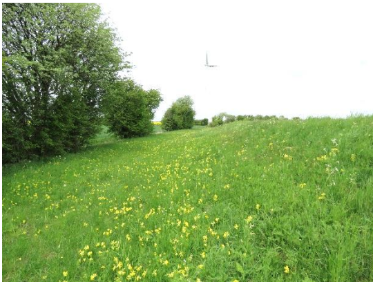
Dige ved Bogø Inddæmningen ved Nakskov med gamle vindmøller.

svaner ved at gøre den nærmeste del af Natura 2000-området uattraktivt for fuglene og ved at skræmme dem væk. Vi mener, at det er et besynderligt natursyn, at en kommune vil jage fugle væk, som kommunen lige modsat er forpligtet at gøre noget særligt for at beskytte, når de optræder som såkaldte udpegningsarter i Natura 2000-området. På samme måde anser vi det for uholdbart, at Lolland Kommune i forhold til Havørne skrev i sin tilladelse til vindmøllerne, at der var en risiko for at true bestanden, men at man så bare måtte håbe, at andre kommuner ville passe på ørnene. Alt det fik DOF Storstrøm medhold i hos de to klagenævn. Desuden fik de andre klagere, blandt andet Danmarks Naturfredningsforening, medhold i en del af deres klagepunkter.